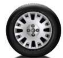
Wieldop 15 inch (accessoire)