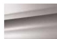
Gris Garbato (M)