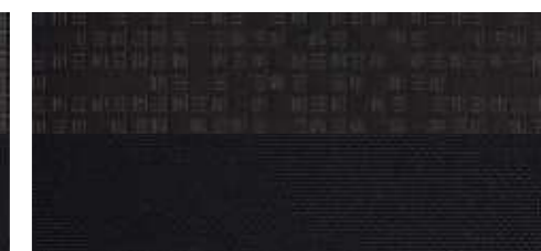
Bekleding Tresti en Iris*