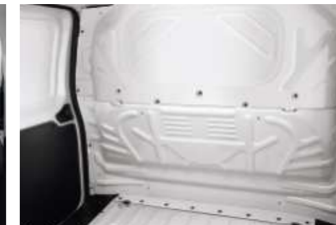
Volledig afgesloten tussenwand (standaard)