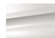
Blanc Banquise (V)