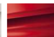
Rouge Tiziano (V)