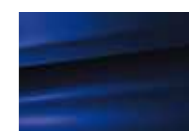
Bleu Line (V)