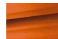
Orange Corail (V)