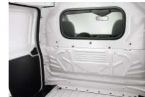
Volledig afgesloten tussenwand met raam (optioneel leverbaar)