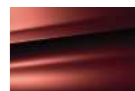
Rouge Malizioso (M)