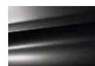
Gris Graphito (M)