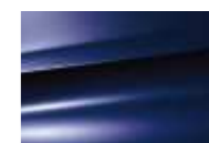
Bleu Nocturne (M)