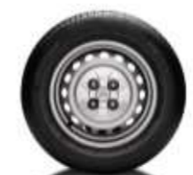
Wieldop semi-style 15 inch