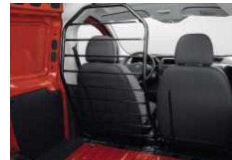
Let op: Niet leverbaar in Nederland