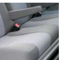
Driezitsachterbank met armsteunen