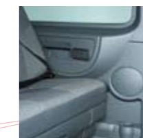
ABS-zijwandbekleding met opbergmogelijkheden

Zowel in beide zijwanden als in de onderzijde van de bankzitting kunt u kleine spullen eenvoudig kwijt. Verder kenmerkt het design van de Jumpy zich door tal van ontwerpinnovaties. In de dubbele cabine loopt de ABS-separatiewand onder de zitbank door, wat betekent dat u over vrijwel de hele breedte extra lange lading onder de bank kunt vervoeren.