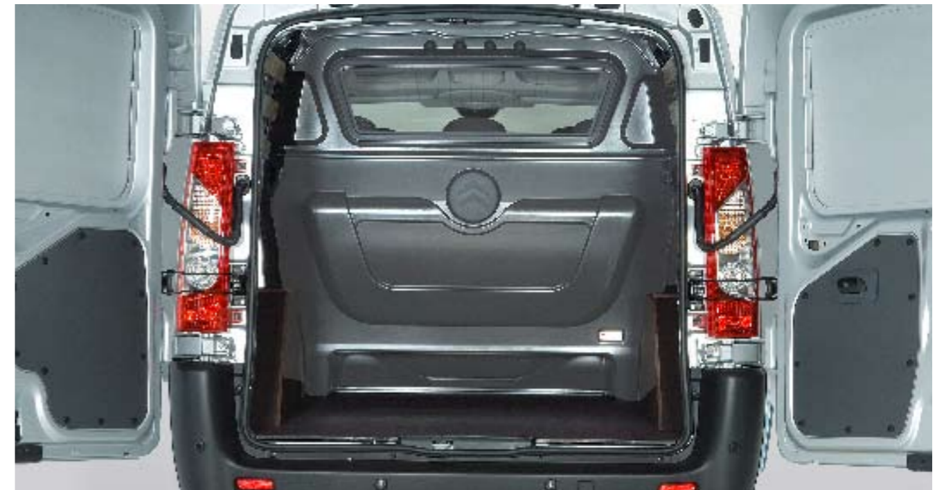
Laadruimte Jumpy DC met ABS-scheidingswand en doorsteekmogelijkheid onder tweede zitrij