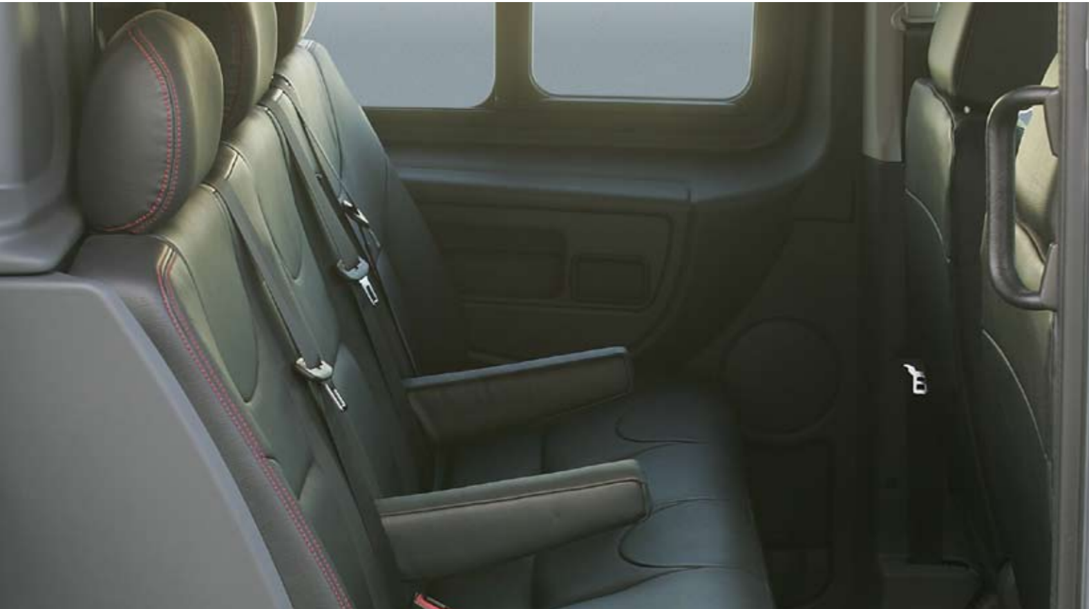
Driezitsachterbank met lederen bekleding en armsteunen

Het bedrijfswagenprogramma van Citroën heeft u als ondernemer heel wat te bieden. Zoals de Citroën Jumpy Dubbele Cabine (DC). Een bedrijfswagen met een specifiek kenmerk: ruimte voor lading en passagiers. Daar zorgt de dubbele cabine voor, die verkrijgbaar is in drie uitvoeringen en met vele opties. Want elk bedrijf is uniek en verdient maatwerk.