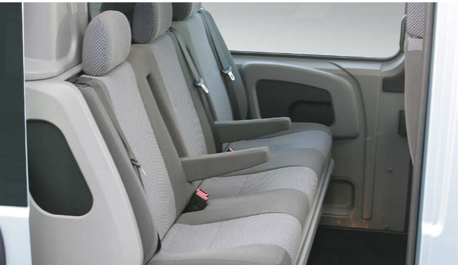
Driezitsachterbank met armsteunen

Het bedrijfswagenprogramma van Citroën heeft u als ondernemer heel wat te bieden. Neem de Citroën Jumper Dubbele Cabine (DC). Een bedrijfswagen met een specifiek kenmerk: ruimte. Daar zorgt de dubbele cabine voor, die verkrijgbaar is in verschillende uitvoeringen en met vele opties. Want elk bedrijf is uniek en verdient maatwerk.