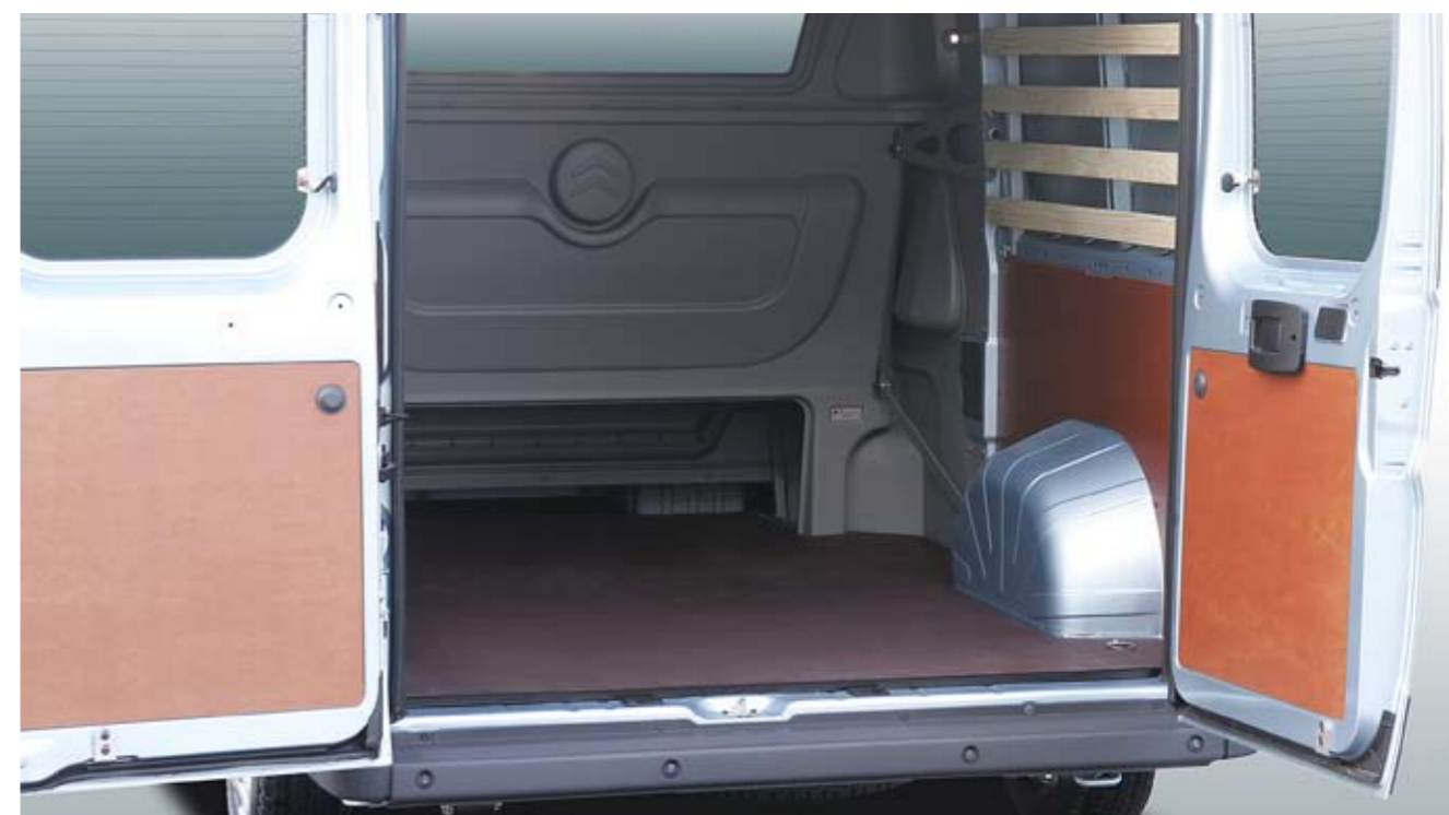
Laadruimte met lat-om-lat zijwandbekleding en houten vloer