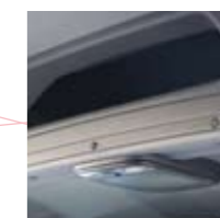
Opbergvak boven bestuurder