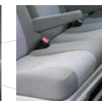
Driezitsachterbank met armsteunen