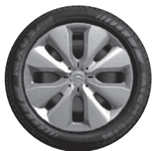
15" stalen wielen met wioldoppen "Asterodea" en 185/65 R 15 T Michelin Energy Saver banden