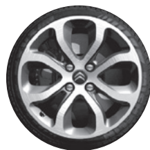
17" lichtmetalen wielen "Sonneberg" en 205/45 R 17 V Michelin Pilot Exalto banden