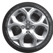
16" lichtmetalen wielen "Valonga" en 195/55 R 16 T Michelin Energy Saver banden