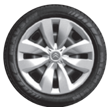
15" stalen wielen met wioldoppen "Whaletail" en 185/65 R 15 T Michelin Energy Saver banden