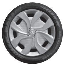
15" stalen wielen met wioldoppen "Aero" en 185/65 R 15 T Michelin Energy Saver banden