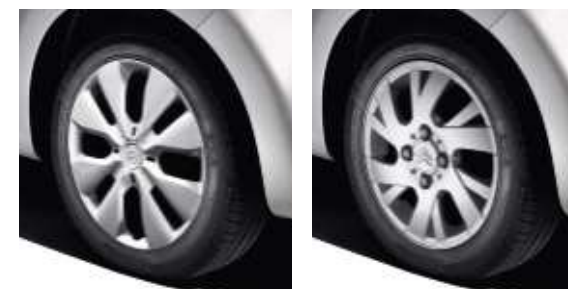
14 inch wiel dop Eole