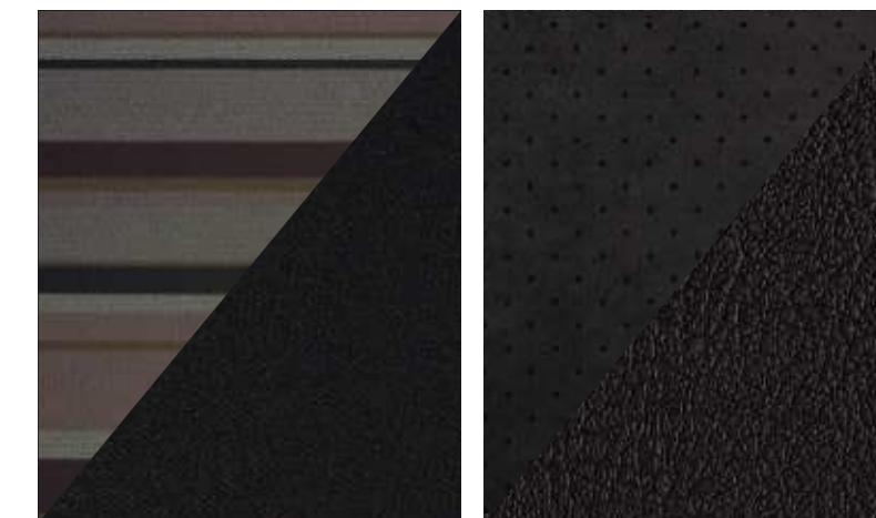
Chaîne en trame Sèvre Bordeaux/Mistral