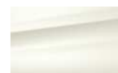
Blanc Antarctique (V)