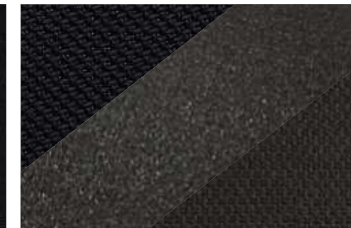
Stof Diamant Noir en Suède/Teq Lama*