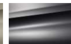
Gris Pilbara (P)