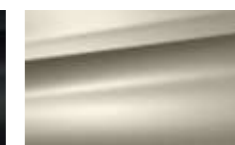
Beige Barkhane (M)