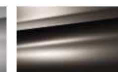
Brun Mangaro (M)