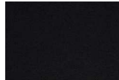
Stof Knit Noir*