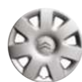
Wieldop Makoré 16-inch