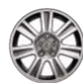
Lichtmetalen wiel Itoka 16-inch