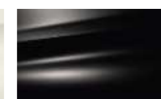
Noir Perle (P)