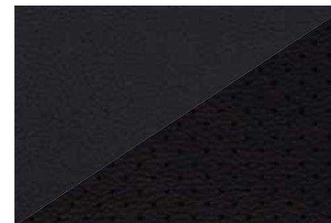
Leer Dulce en Dulce perforé Noir*