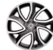
Lichtmetalen wiel Sycomore 18-inch