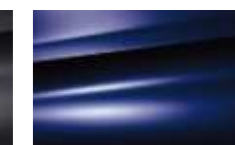
Bleu Muzzano (P)

* In combinatie met andere materialen - (M) = metalliclak (P) = pareleffectlak (V) = vernislak - De metallic- en pareleffectlakken en Blanc Antarctique zijn leverbaar als optie.